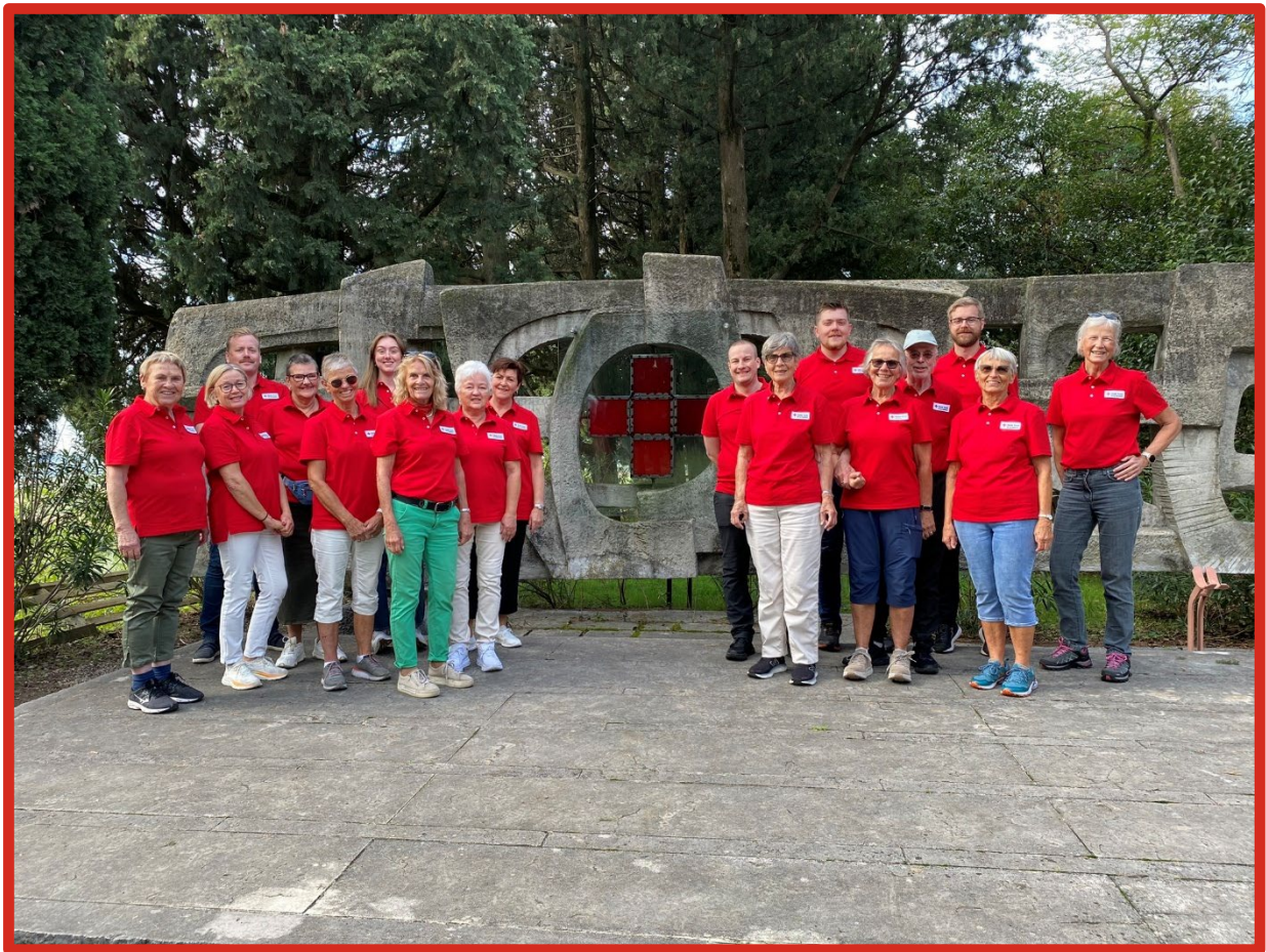
Frivillige ved minnesmerket i Solferino - Memoriale della Croce Rossa